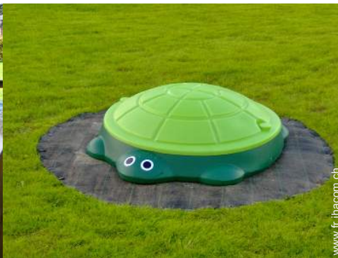
bac à sable