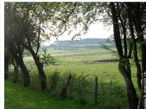
vue sur prairie