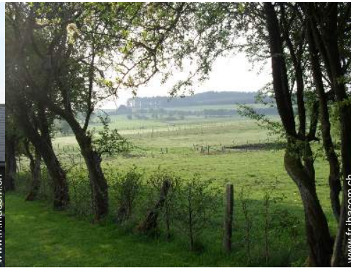
vue sur prairie