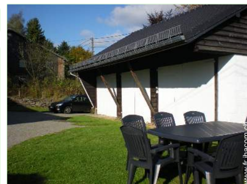
Equipements extérieurs à disposition des hôtes