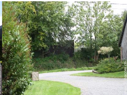
vue sur cour