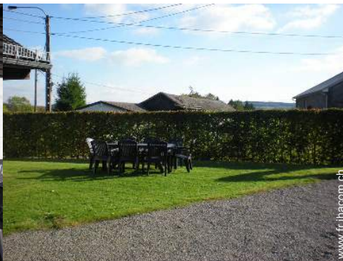
Installation extérieure à disposition des hôtes