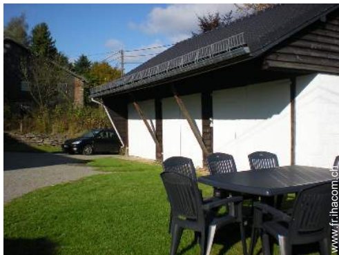
Equipements extérieurs à disposition des hôtes