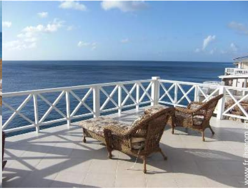
vue sur océan