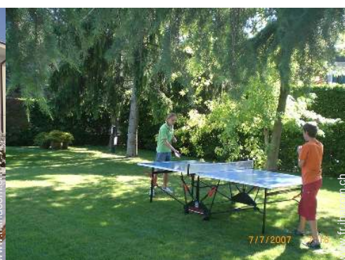
table de ping-pong