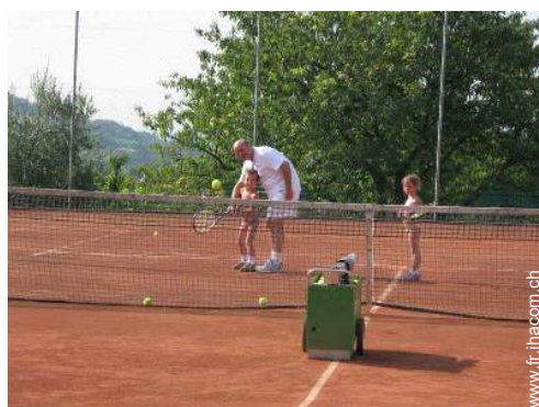
Tennis - terre-battue