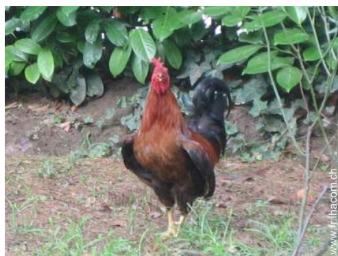
animaux de ferme