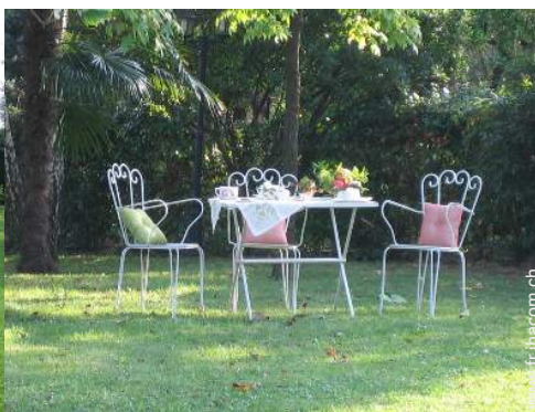
vue sur prairie