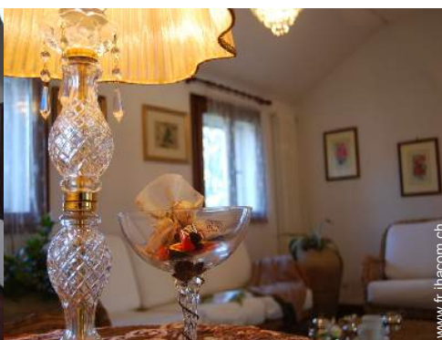
vue depuis le bureau