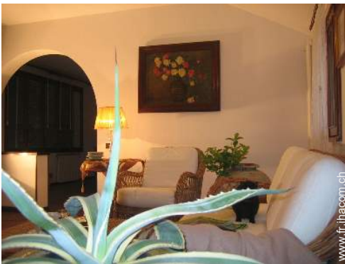
vue depuis le bureau