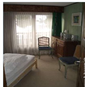
lits jumeaux simple

Table(s) de jardin, 6 chaise(s) de jardin