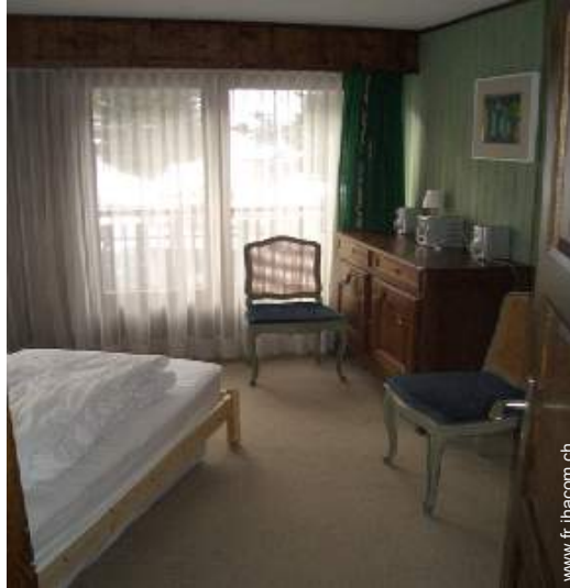
lits jumeaux simple