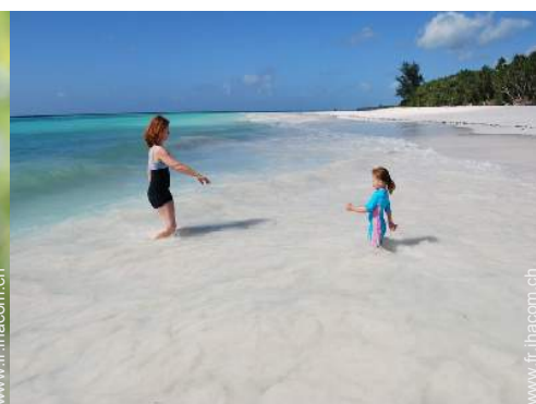
accès direct plage