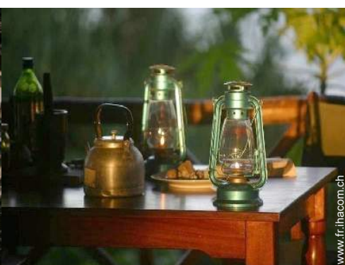
Confort intérieur et équipements