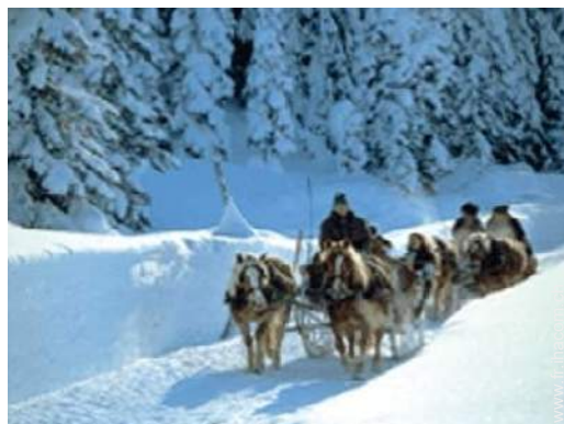
balade en calèche