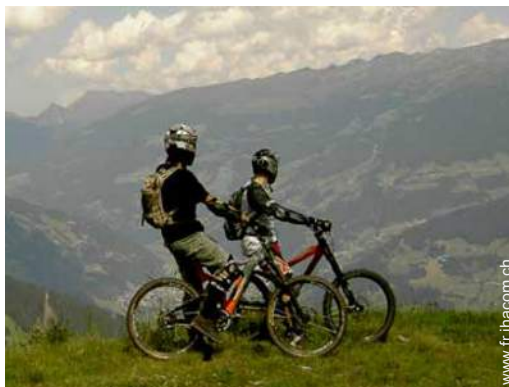
VTT (itinéraire circuit)