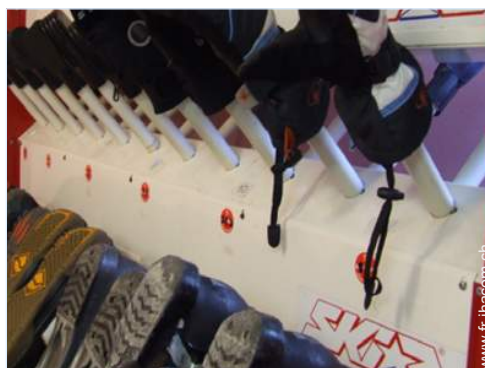
sèche botte ski