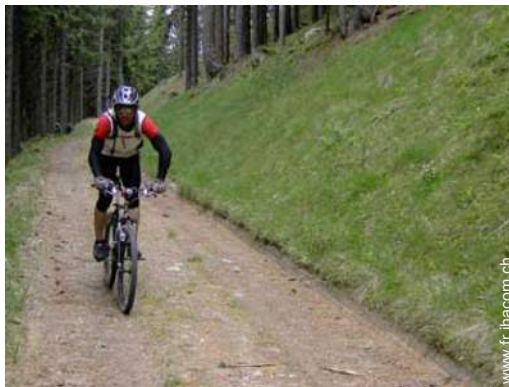
VTT (itinéraire circuit)