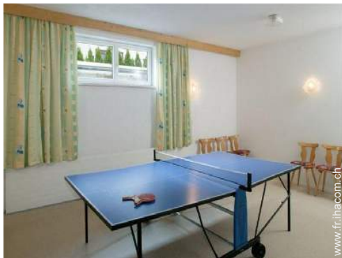
table de ping-pong