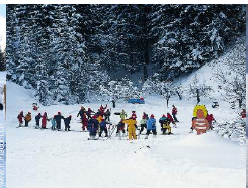
jardin de ski enfant