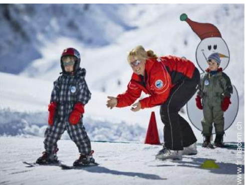
jardin de ski enfant