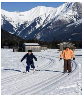
ski de fond