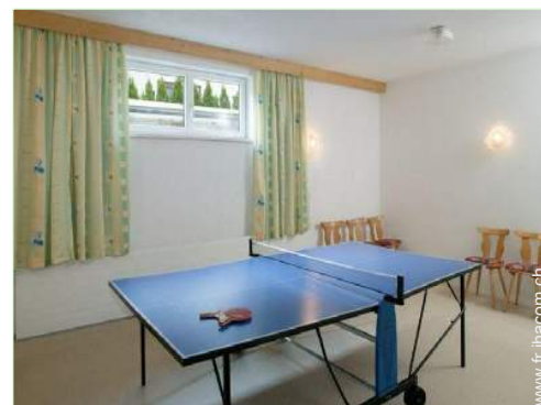
table de ping-pong