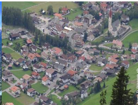
vue sur centre village