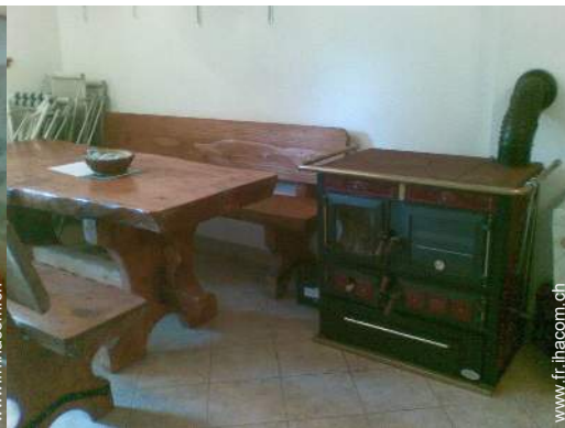
poêle à bois