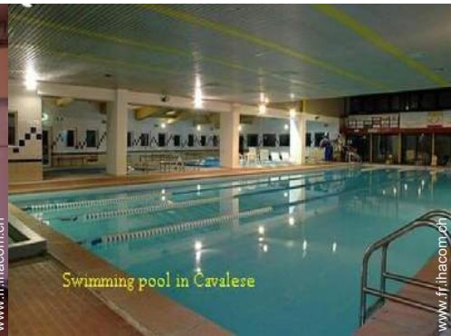
Swimming pool in Cavalese