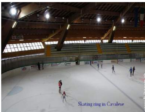
Skating ring in Cavalese