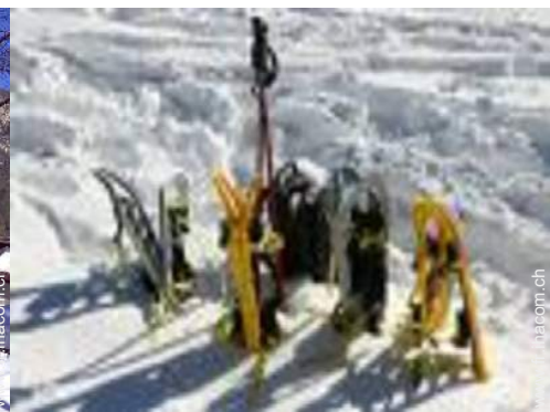
ski de randonnée