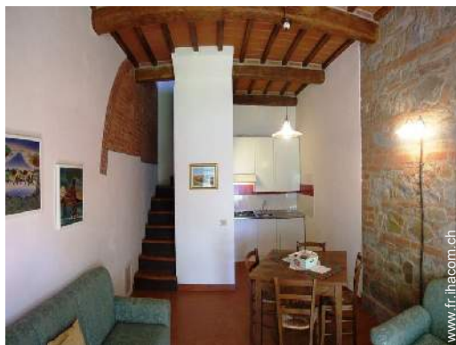
Agencement intérieur à disposition des hôtes