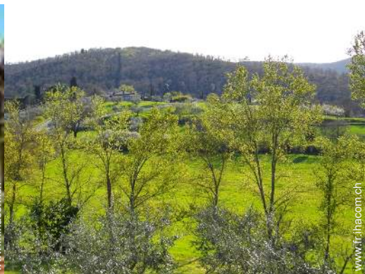
vue sur campagne