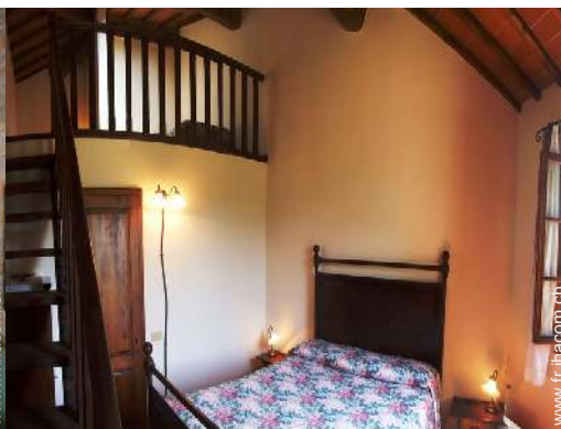
Agencement intérieur à disposition des hôtes