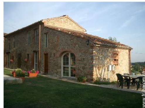
Maison de Campagne