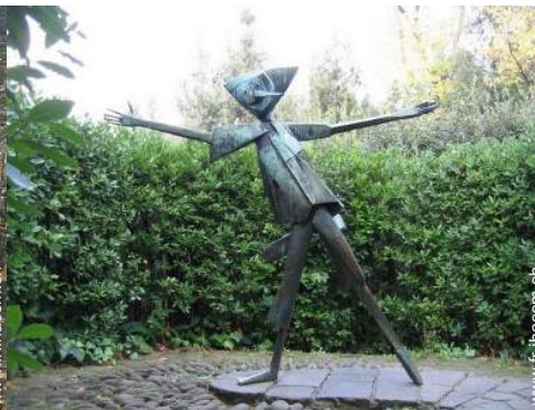
Attrait et détente