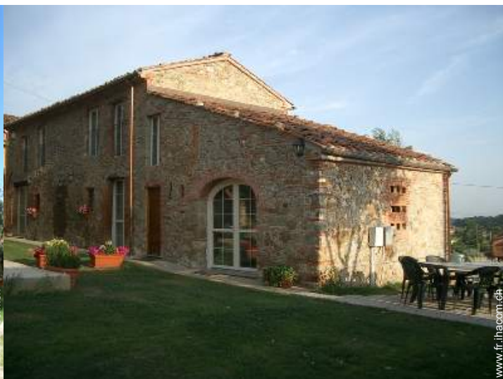
Maison de Campagne