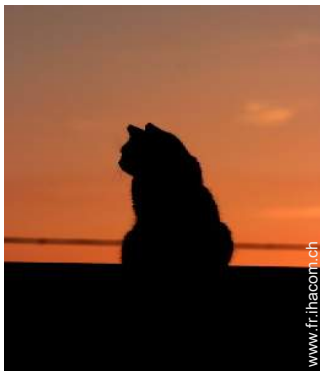
Les animaux de la maison