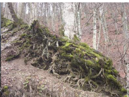
vue sur forêt