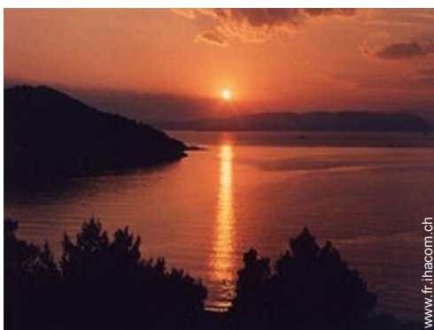
spot de surf