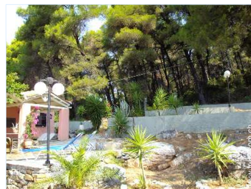
vue sur forêt