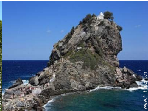
plage de rocher