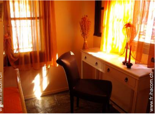
moustiquaire aux fenêtres