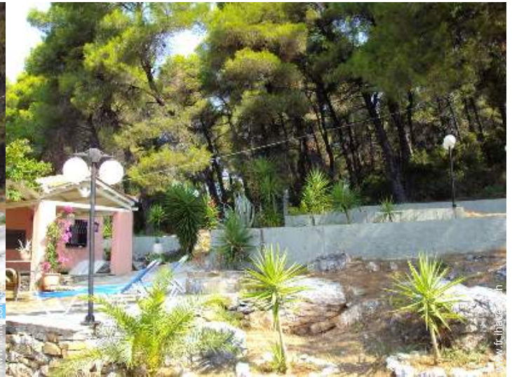
vue sur forêt