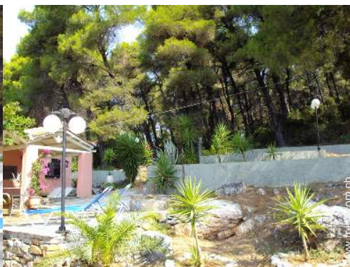
vue sur forêt