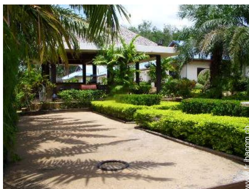
terrain de pétanque