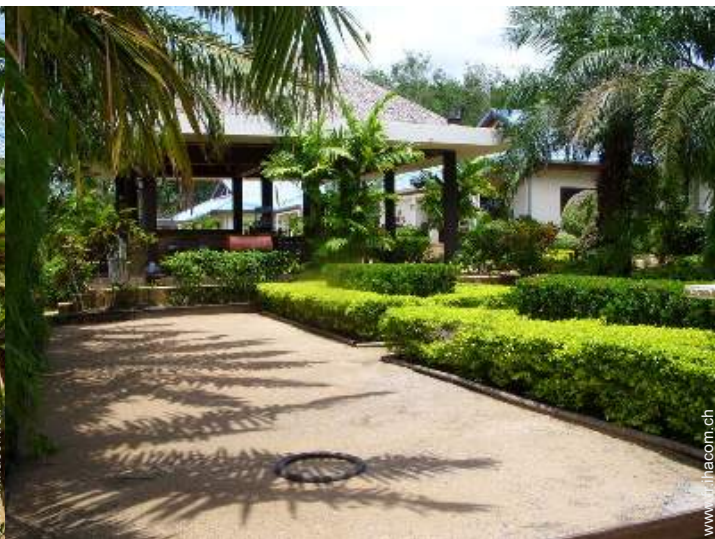
terrain de pétanque