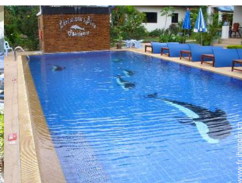
Piscine à débordement