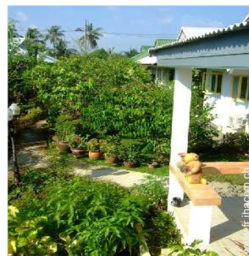
vue sur cour