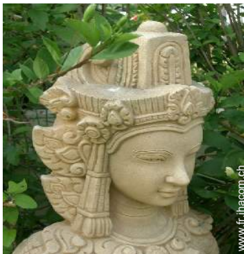
Propriété de Prestige