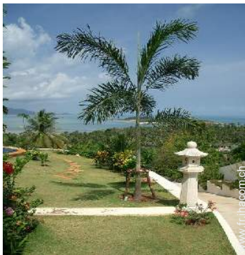
Propriété de Prestige