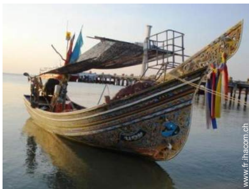
excursion en bateau