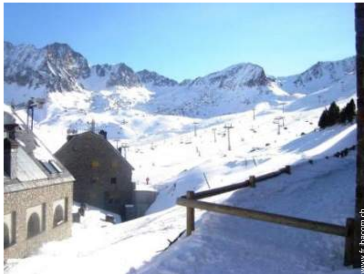
pistes de ski