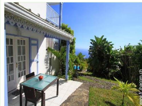
Studio de Charme