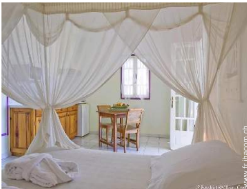
Studio de Charme