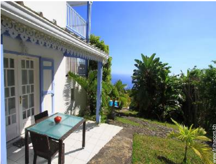
Studio de Charme