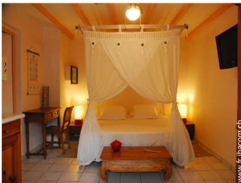
Studio de Charme