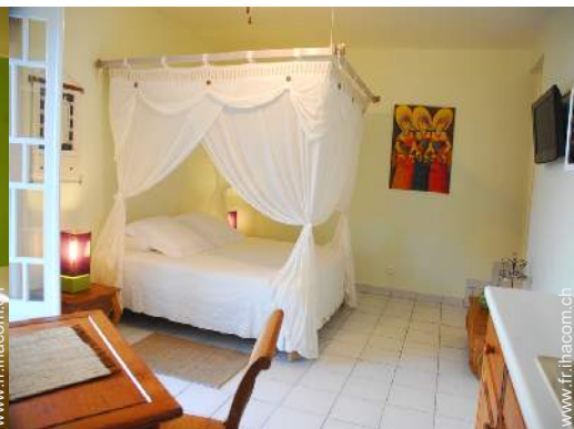
Studio de Charme