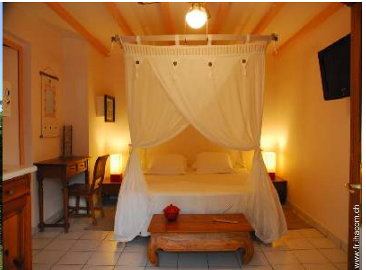
Studio de Charme