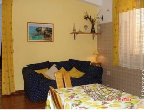
canapé-lit(s) 2 pers