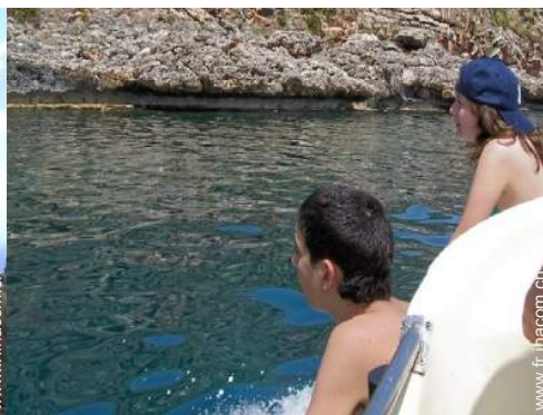
excursion en bateau