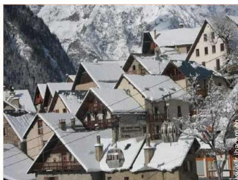
vue sur village