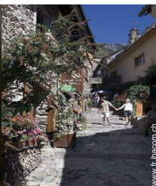
vue sur rue piétonne