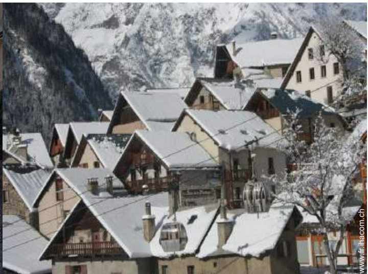
vue sur village