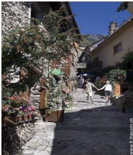
vue sur rue piétonne