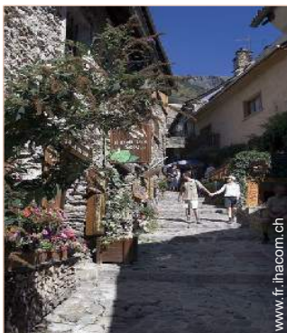
vue sur rue piétonne