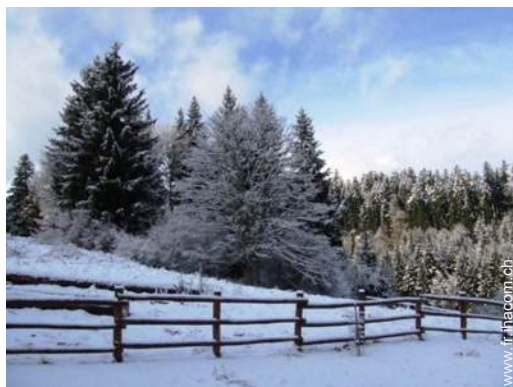
vue sur forêt