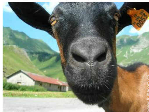
Présence sur place