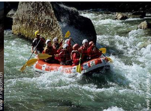
loisirs d'été à proximité