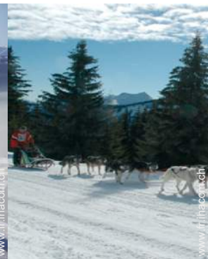
traîneau à chien