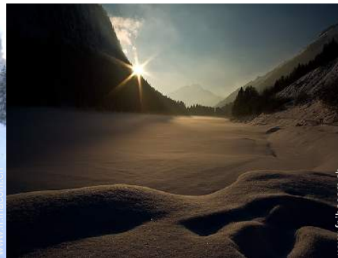
loisirs d'hiver à proximité