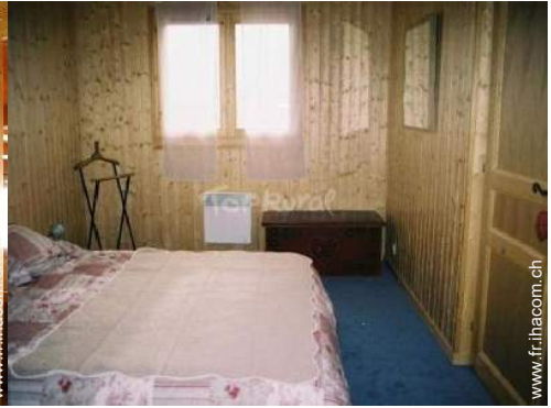
chambre du propriétaire