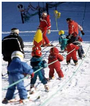
école de ski