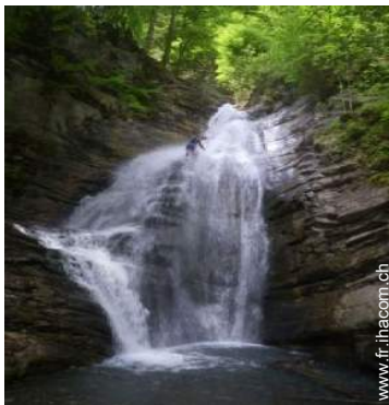
chemin de promenade