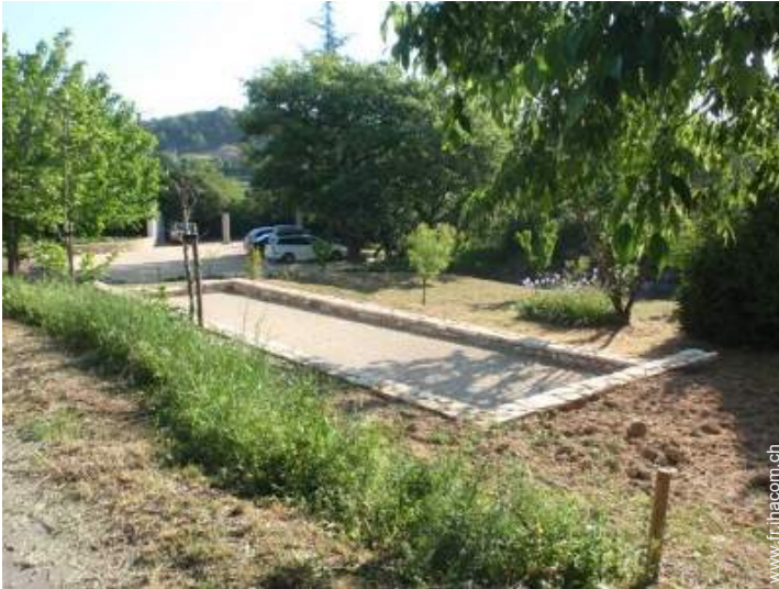
jeux de boules de pétanques