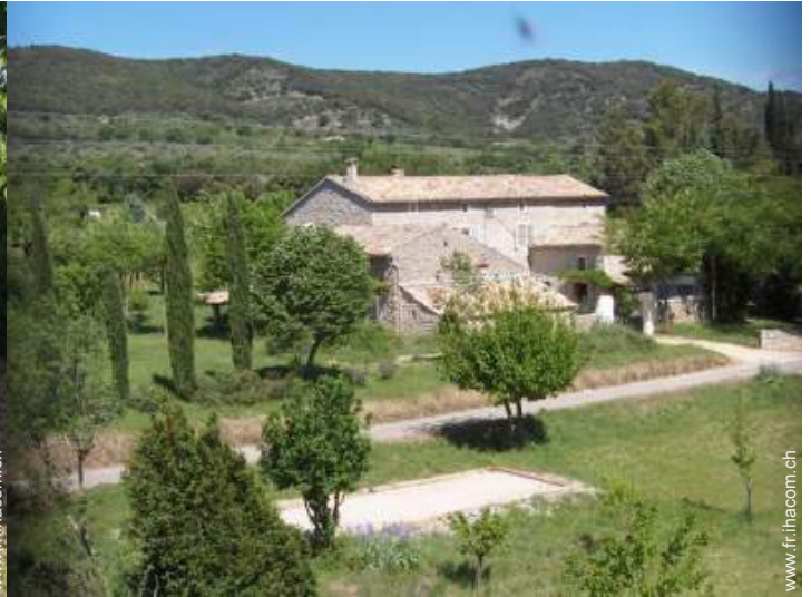
Mas de Charme