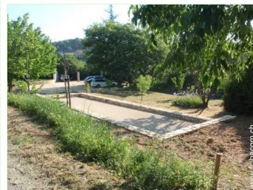
jeux de boules de pétanques

- Centre village 4km - Location de vélo/VTT 4km - Location de moto/scooter 4km - Boulangerie 2,5km - Petits commerces 2,5km - Super marché 4km - Boutiques de luxe et marques 4km - Salon de coiffure 4km - Cyber café 4km - Poste 2,5km - Banque 4km - Distributeur automatique de billets 4km - Pharmacie 4km - Médecin 4km - Infirmière 4km - Hôpital 25km