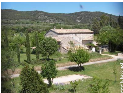
Mas de Charme