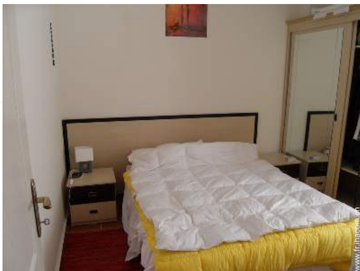
Confort intérieur et équipements