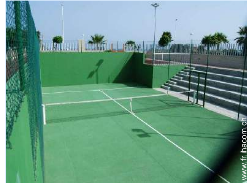
Tennis - surface dure