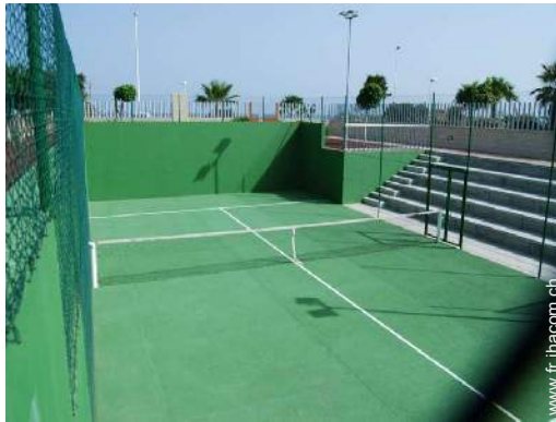
Tennis - surface dure