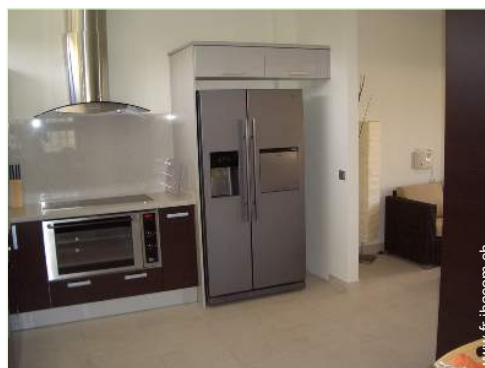
machine à glaçon/ice maker