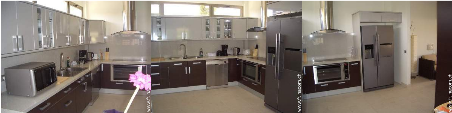
grande cuisine indépendante