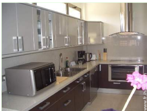
grande cuisine indépendante

Piscine privée, rectangulaire (longueur 8m, largeur 4m), à débordement, eau de mer, chauffée, accès par escalier, accès par échelle, douche extérieure