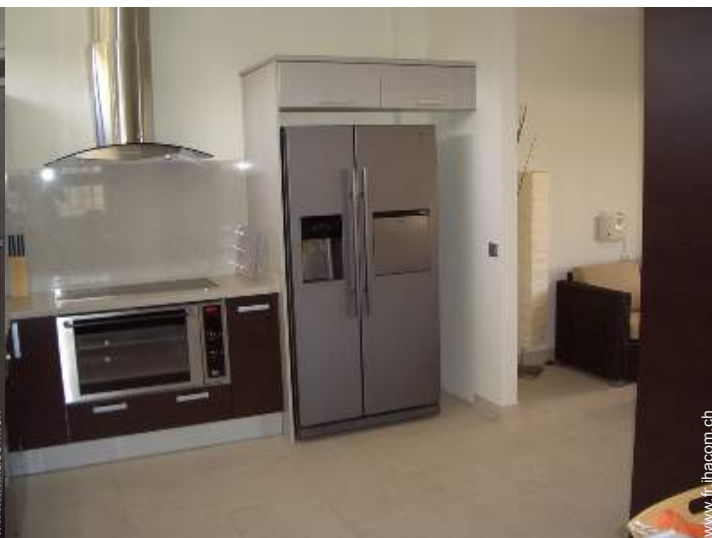
machine à glaçon/ice maker