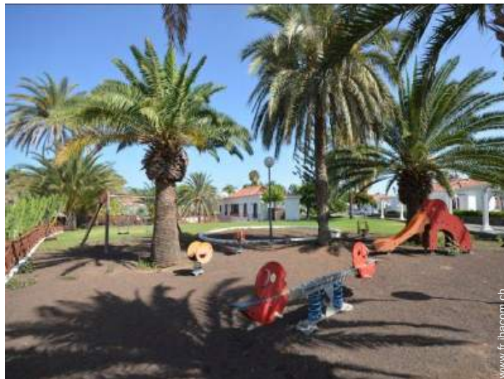
bac à sable