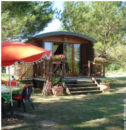
Roulotte de Charme