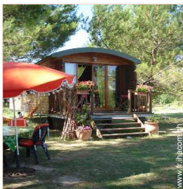
Roulotte de Charme