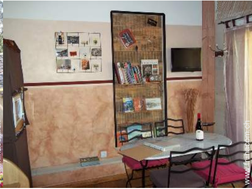
Confort intérieur à disposition des hôtes