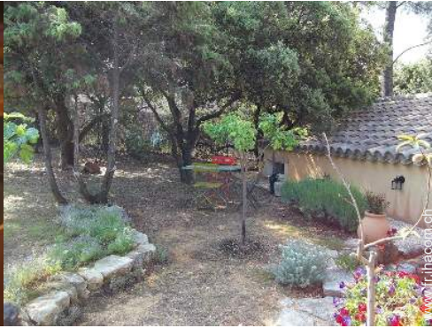
Installation extérieure à disposition des hôtes