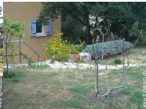
Cadre extérieur à disposition des hôtes