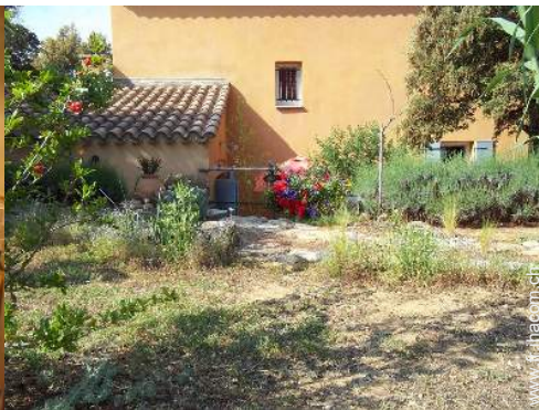
Cadre extérieur à disposition des hôtes