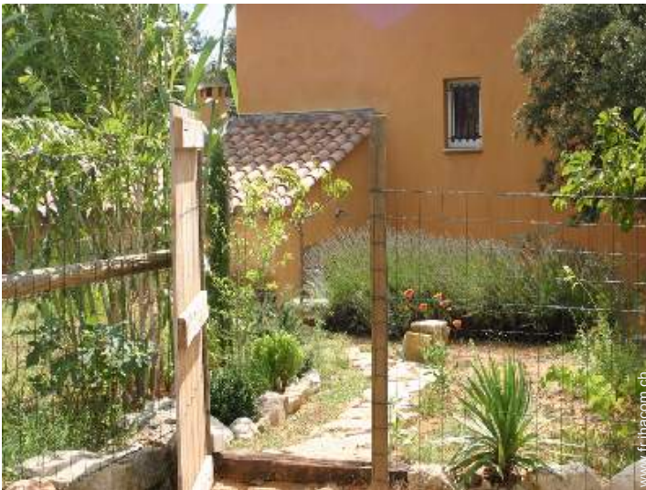
Cadre extérieur à disposition des hôtes