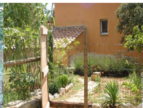
Cadre extérieur à disposition des hôtes