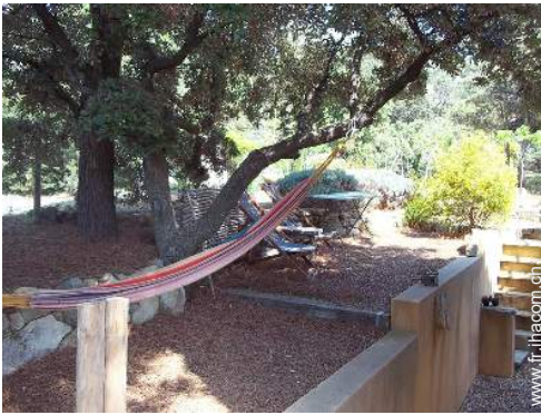
Installation extérieure à disposition des hôtes