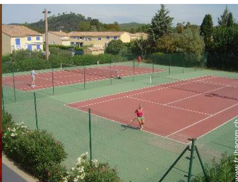
tennis dans la résidence