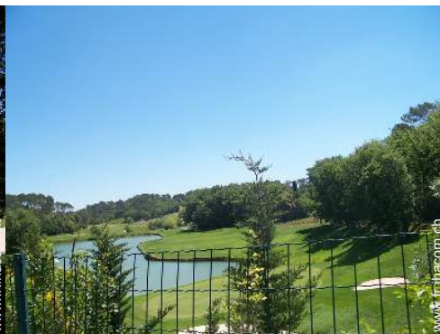
parcours de golf 18 trous