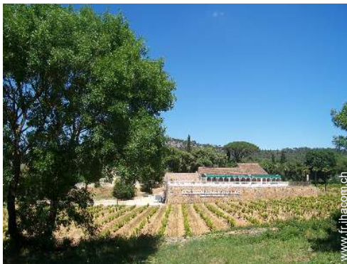
cave et dégustation de vin