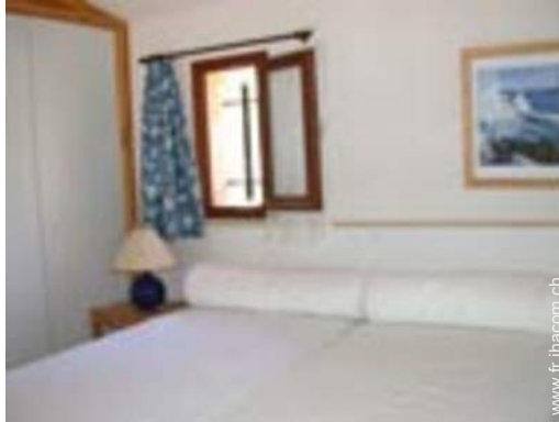
Couchage - lit(s)