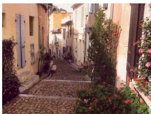
Maison de Ville