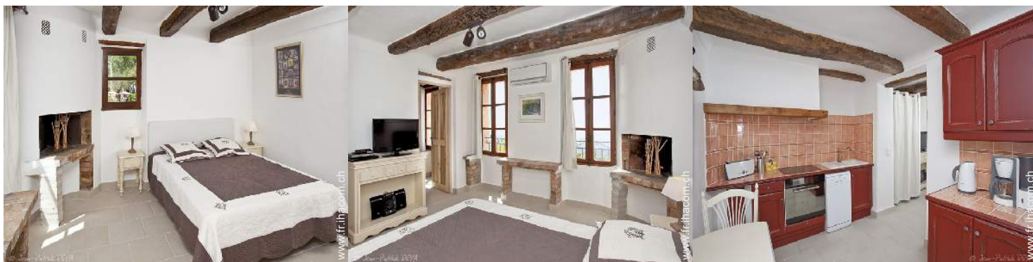
Confort intérieur à disposition des hôtes