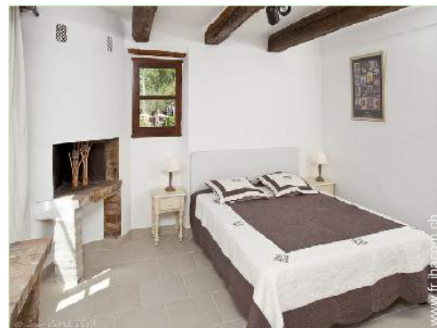
Confort intérieur à disposition des hôtes