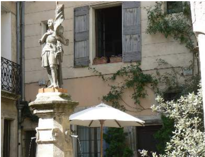
Maison de Charme en Pierre