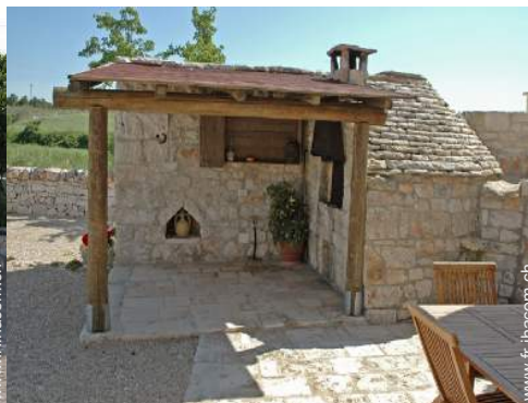
four à pizza