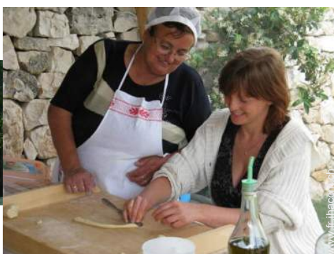
préparation repas local