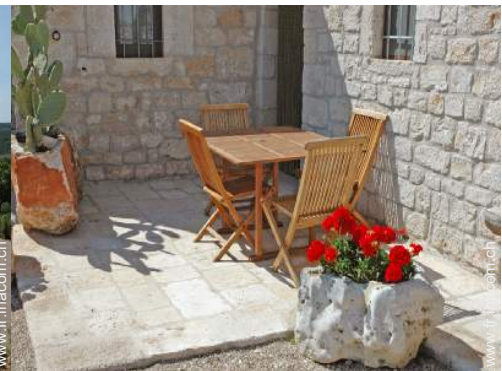
chaise(s) de jardin