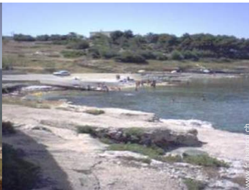
plage de rocher