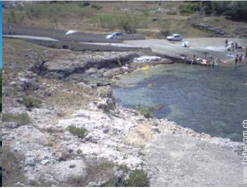
plage de rocher