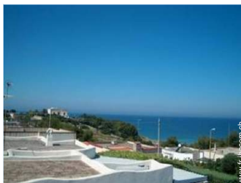
vue depuis la terrasse sur toit