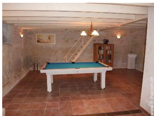
table de billard