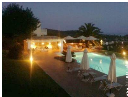
vue depuis la véranda