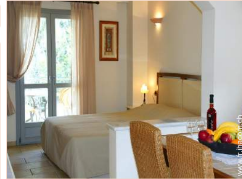
Maisonnette de Charme