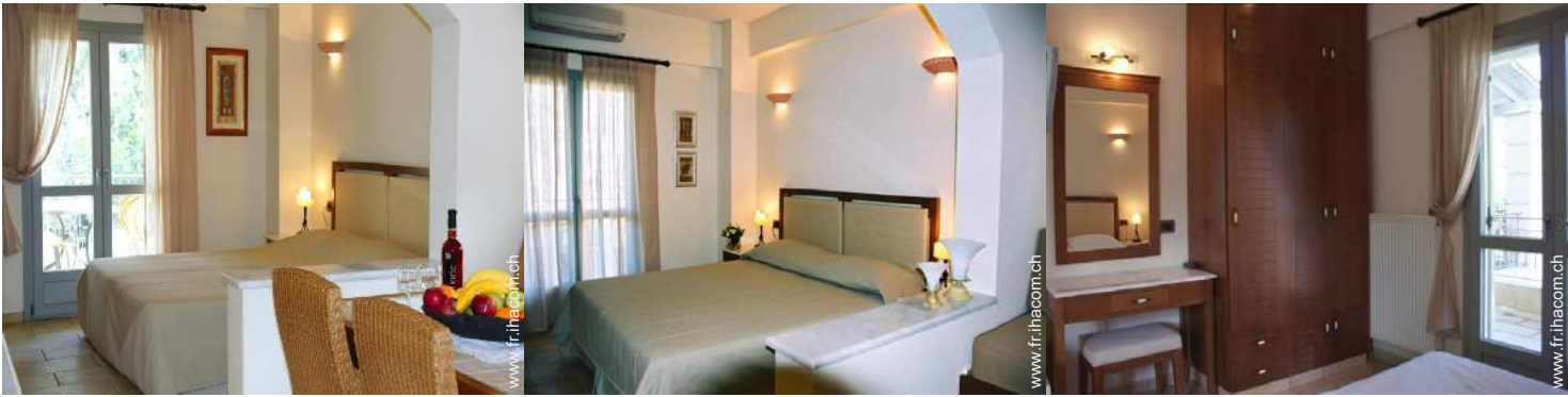
Maisonnette de Charme