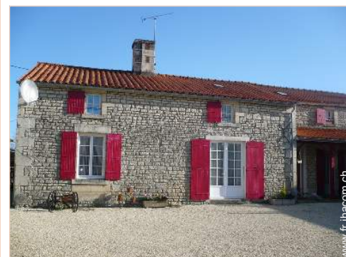
Ancien Corps de Ferme de Charme