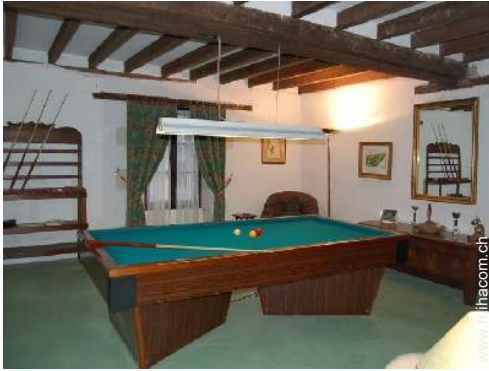
table de billard