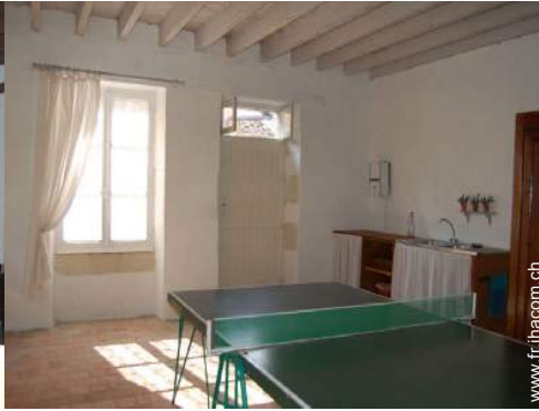
table de ping-pong