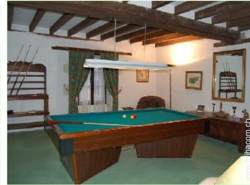
table de billard