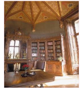
Agencement intérieur à disposition des hôtes