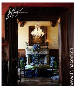
Agencement intérieur à disposition des hôtes